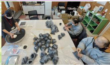
「社協めぐり」で作った 黒豆の選別、袋詰め作業