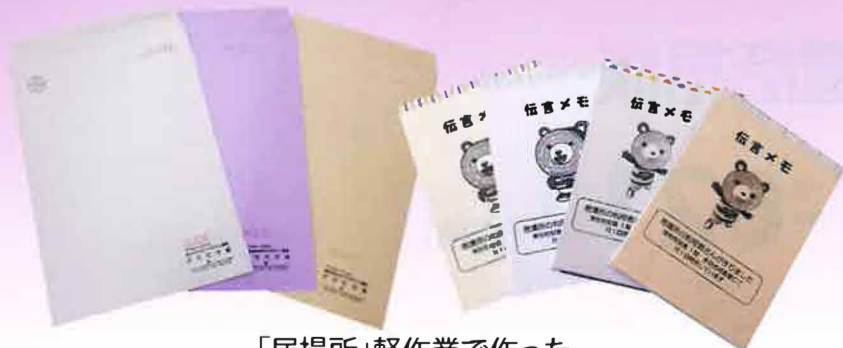
「居場所」軽作業で作った 再生封筒&裏紙再利用封筒メモ帳