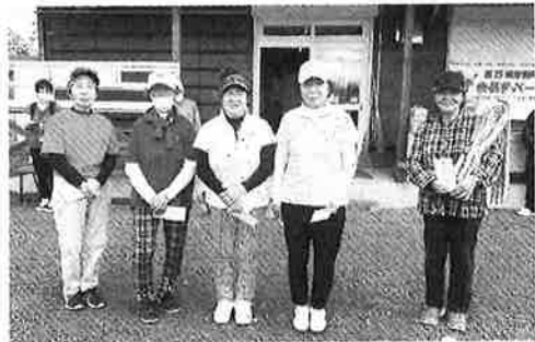
女性の部 入賞者の方々