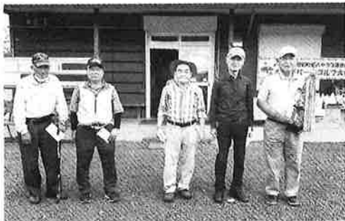
男性の部 入賞者の方々